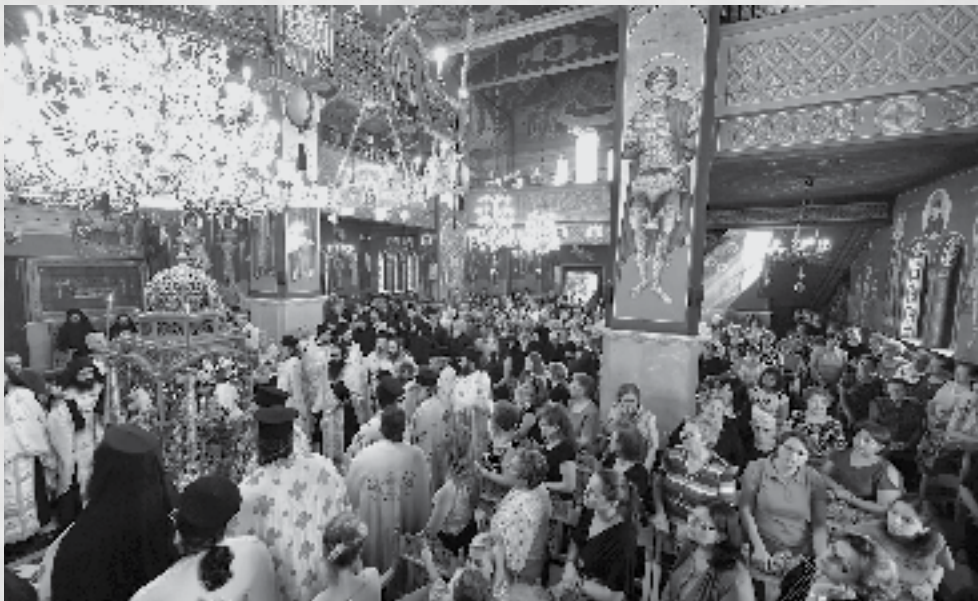
Το προσκύνημα του Τιμίου Σταυρού στη Μητρόπολη Λαγκαδά

ΥΓ. Για όσους είναι επιφυλακτικοί στο θαύμα και κρατούν μικρό καλάθι, δεν πειράζει, πάντα έτσι γινόταν στην Εκκλησία. Ο Σταυρός για άλλους ήταν σκάνδαλο και για άλλους μαρτία, για άλλους όμως είναι δύναμη Θεού και ελπίδα ζωής και σωτηρίας. Το «έρχου και είδε» του Χριστού στους πρώτους μαθητές, ισχύει και για τους σημερινούς ανθρώπους. ΔΗΜΟΣΙΕΥΘΗΚΕ στο lagadas.net