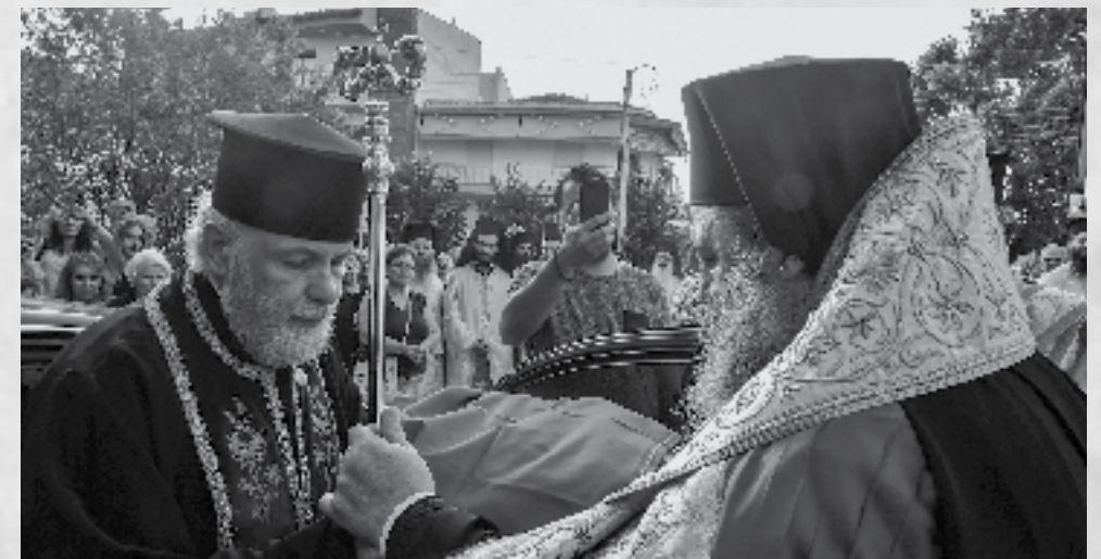
Το προσκύνημα του Τιμίου Σταυρού στη Μητρόπολη Λαγκαδά