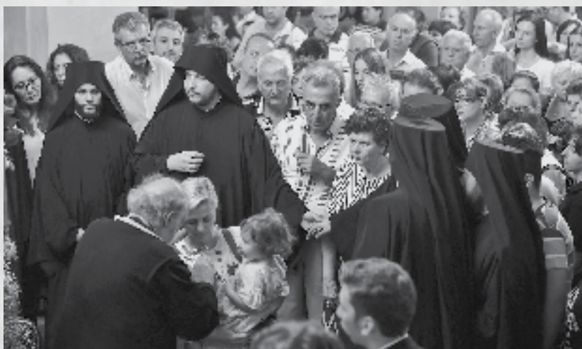
Το προσκύνημα του Τιμίου Σταυρού στη Μητρόπολη Λαγκαδά