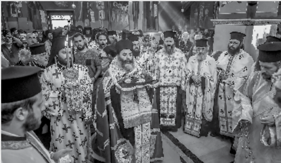
Το προσκύνημα του Τιμίου Σταυρού στη Μητρόπολη Λαγκαδά