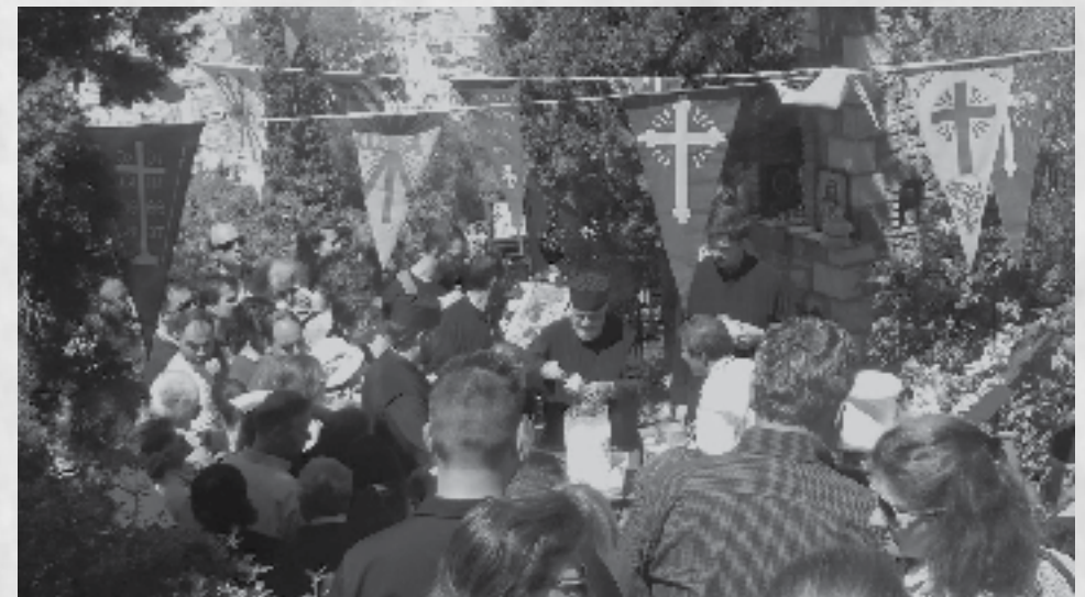
Η διανομή γάλακτος κατά την εορτή του Αγίου Γεωργίου

Επιμέλεια κειμένου π. Χαράλαμπος Βαρβαγιάννη