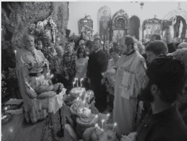
Από την εορτή του Αγίου Ισιδώρου του Χιοπολιτου.