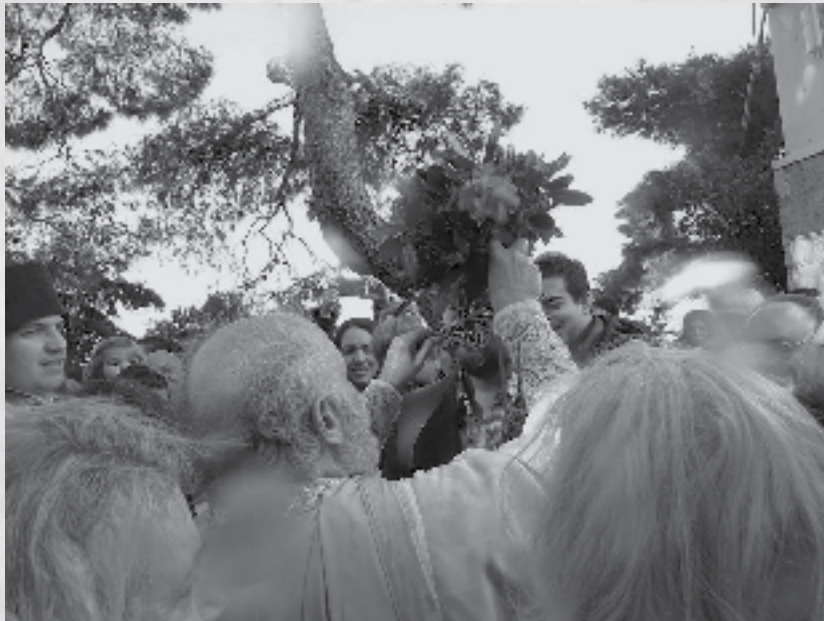
Τα Άγια Θεοφάνεια στους Αγίους Ισιδώρους

Μαρία Παπαχρήστου Γιατρός-Παιδοδόγος Εντατικοδόγος