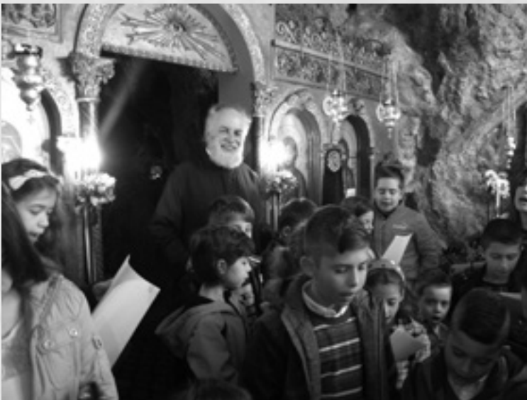
Χριστουγεννιάτικη εορτή στους Αγίους Ισιδώρους