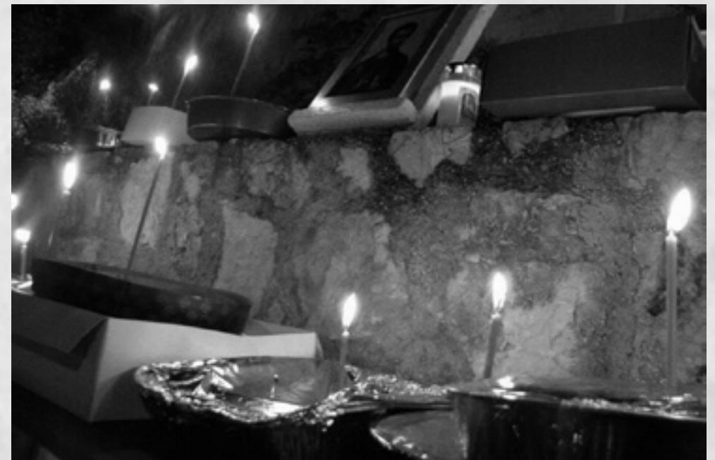
Οι πίτες προς τιμή του Αγίου Ιούδα του Θαδδαίου