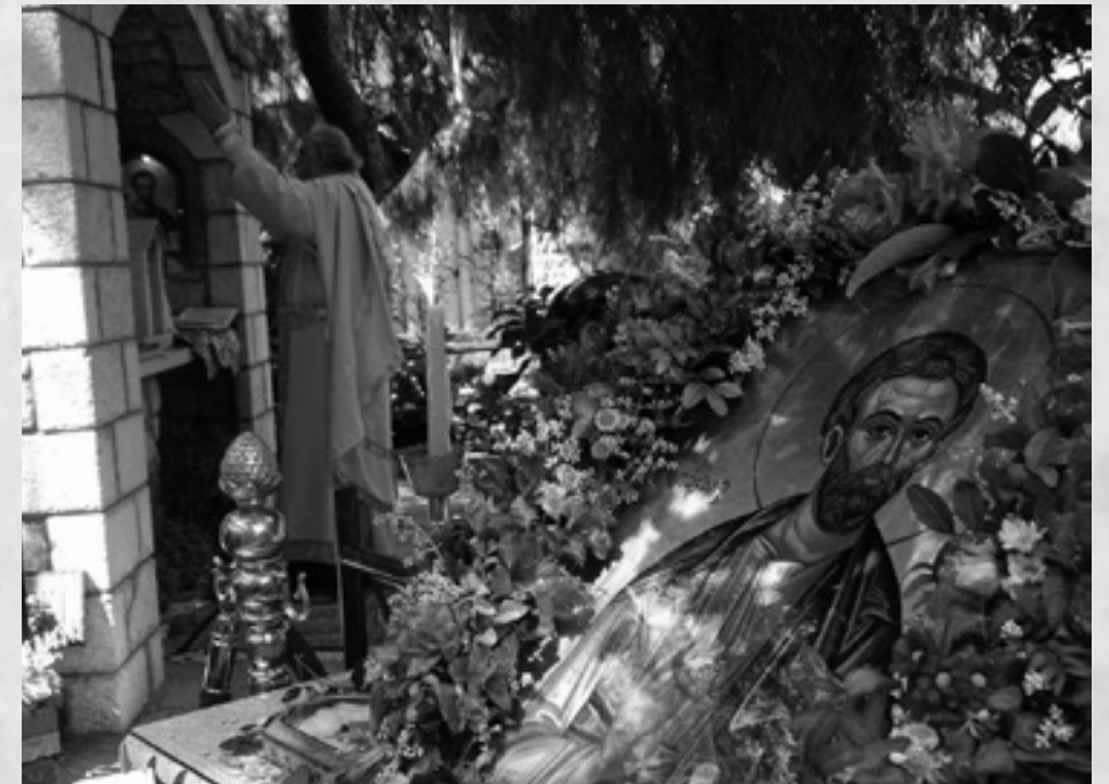
Η Θεία Λειτουργία στο Εικοστάσιο του Αγίου Ιούδα του Θαδδαίου

Επιμέλεια π. Δημήτριος Καββαδάς π. Σπυρίδων Ταδάρης