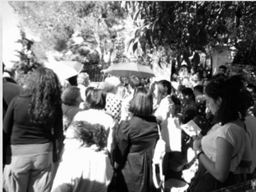
Προσκυντές στην εορτή του Αγίου Ιούδα του Θαδδαίου