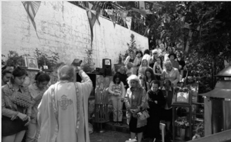
Από την εορτή του Αγίου Ιούδα του Θαδδαίου