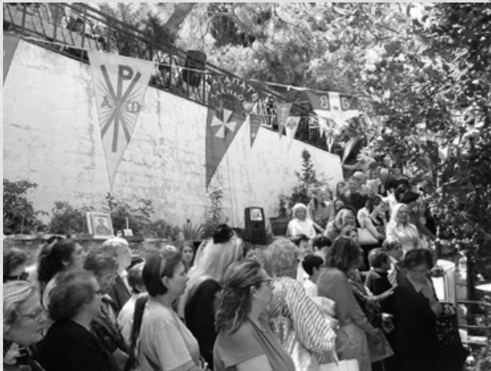
Από την ιερά πανήγυρη του Αγίου Ιούδα του Θαδδαίου