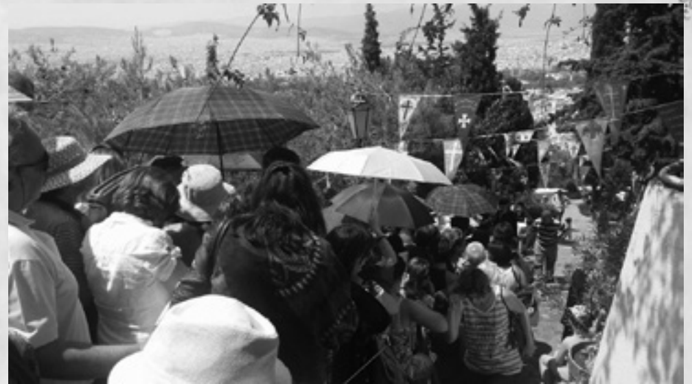
Από την ιερά πανήγυρη του Αγίου Ιούδα του Θαδδαίου