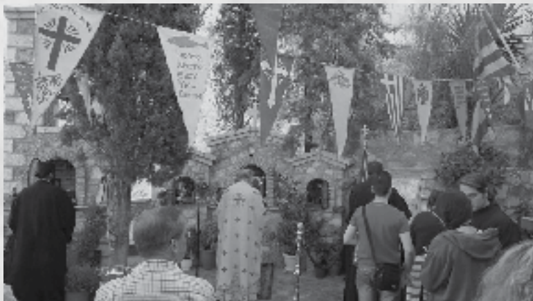
Η Θεία Λειτουργία στο Εικονοστάσιο του Χριστού