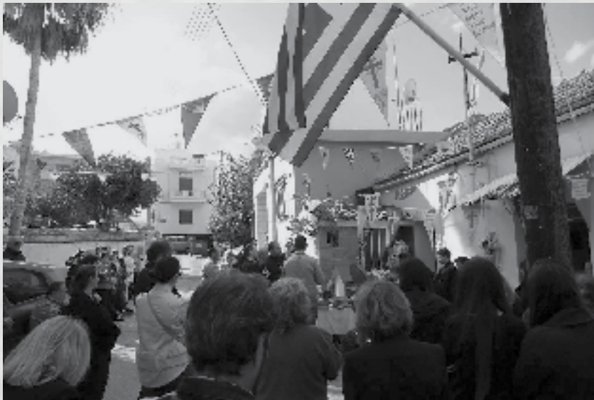
Προσκυντές παρακολουθούν την Θεία Λειτουργία για την εορτή του Αγίου Δημητρίου στα Χανιά της Κρήτης.