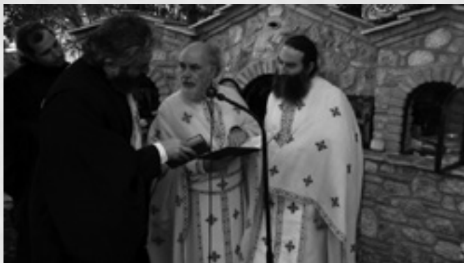
Στιγμιότυπο κατά την τελετή των θυρανοξίων του Εικονοστασίου την Κυριακή 19 Οκτωβρίου