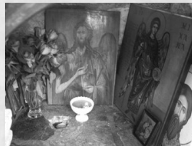
Το εσωτερικό του Εικονοστασίου του Αγίου Ιωάννου του Προδρόμου