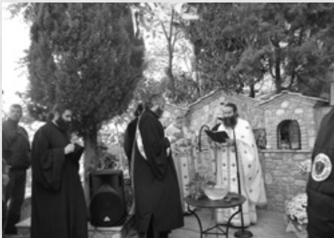
Στιγμιότυπο κατά την τελετή των θυρανοξίων του Εικονοστασίου την Κυριακή 19 Οκτωβρίου