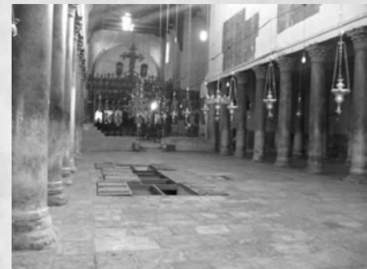
Η Βασιλική της Γεννήσεως στην Βηθλεέμ

Ιγνάτιος Θ. Χατζηνικολάου Θεοδόχος-τ. Λυκειάρχης-Γεροκύρηξ