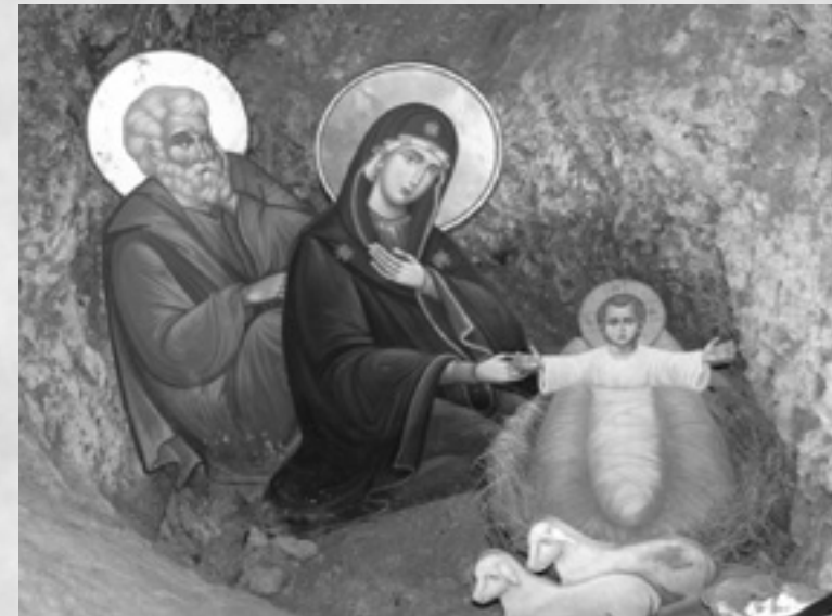
Η Φάτην των Αγίων Ισιδώρων

στο χρυσό, αυτός θα εξακολουθεί να λάμπει. Με ποιο άλλο αντικείμενο θα μπορούσε να συμβολιστεί καλύτερα η προσευχή αν όχι με το λιβάνι; Όπως ο καπνός από το λιβάνι γεμίζει την εκκλησία ολόκληρη, έτσι γεμίζει κι η προσευχή ολόκληρη την ύπαρξη του ανθρώπου. Όπως ο καπνός ανεβαίνει ψηλά, έτσι ανεβάζει η προσευχή την ψυχή του ανθρώπου στον Θεό. «Κατευθυνθήτω η προσευχή μου ως θυμιάμα ενώπιόν σου», λέει ο Ψαλμωδός (Ψαλμ. ρμα' 2). Είναι γεγονός πως κι άλλα πράγματα βγάζουν καπνό, μα κανένας καπνός δεν εμπνέει την ψυχή για προσευχή. Ποιο άλλο επίγειο αντικείμενο θα μπορούσε να συμβολίσει καλύτερα την αθανασία από το μύρο; Η θνητότητα αποπνέει δυσωδία, ενώ η αθανασία έχει μία διαρκή ευωδία. Οι μάγοι από την Ανατολή συμβόλισαν έτσι έστω κι ανεπίγνωστα ολόκληρη τη χριστιανική πίστη. Ξεκίνησαν από την Αγία Τριάδα κι έφτασαν ως την Ανάστασή και την αθανασία του Κυρίου Ιησού και των πιστών Του. Δεν είναι απλοί προσκυνητές, μα πραγματικοί προφύτες. Προφύτες τόσο της χριστιανικής πίστης όσο και της ζωής και του έργου του Χριστού. Από μόνοι τους, με τη δική τους αντίληψη και γνώση, δεν θα τα ήξεραν όλα αυτά. ταν η πρόνοια του Θεού που τους έστειλε στη Βηθλεέμ και τους έδωσε το παράξενο αυτό άστρο να τους οδηγήει.