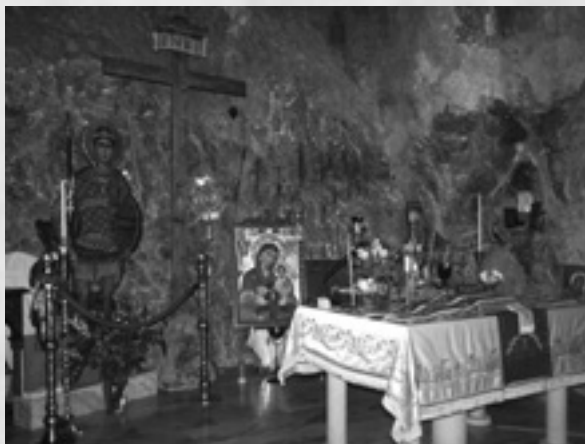
Το Ιερό Βήμα των Αγίων Ισιδώρων