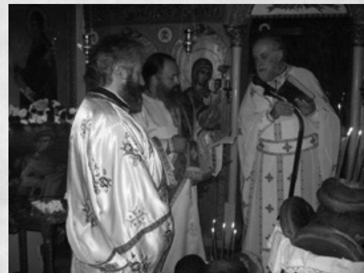
Αρτοκλασία κατά την εορτή των νέων του Ιερού μας Ναού